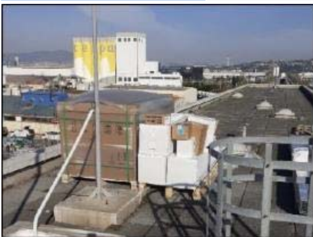
Ecoparc: Abassegament de material