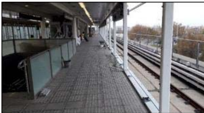
Zal / Riu Vell: Andana