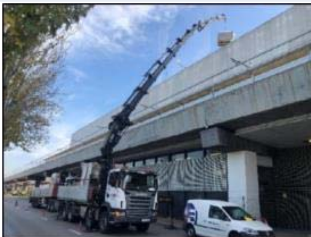
Port Comercial/La Factoria: Descàrrega de material