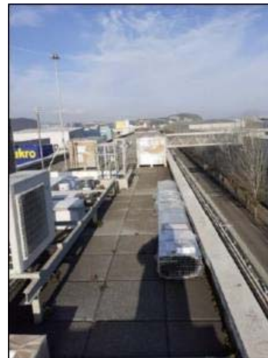
ZAL/RIU VELL: Abassegament de material