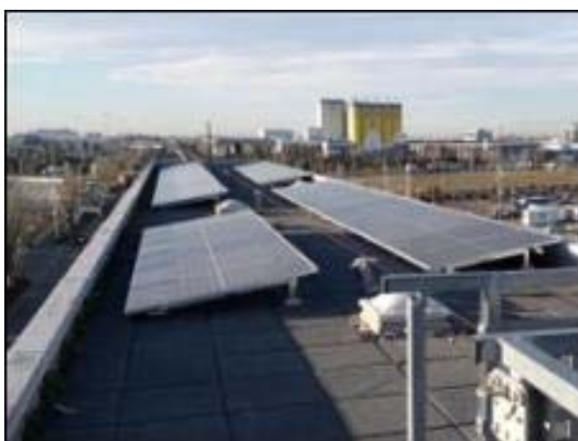
Port Comercial/La Factoria: Plaques muntades