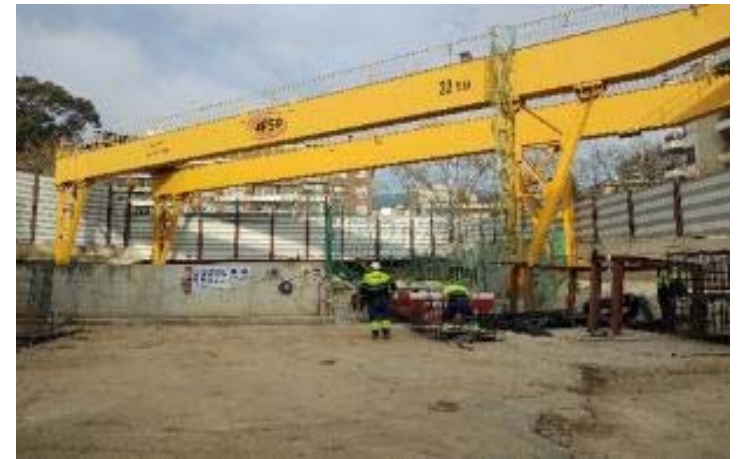
Treballs previs per reinici obra