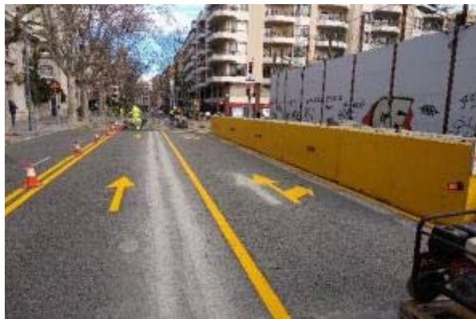
Desviament Passeig Bonanova