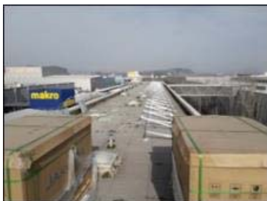
ZAL / RIU VELL: Abassegament de material i perforacions