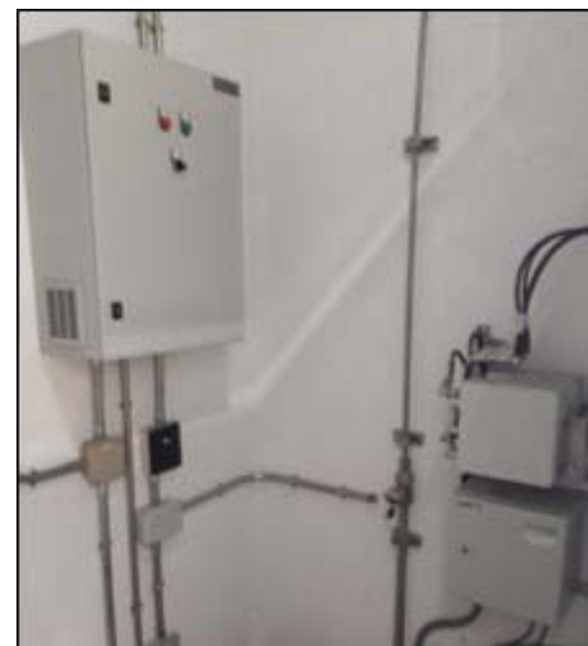
Ecoparc: Muntatge de quadres elèctrics