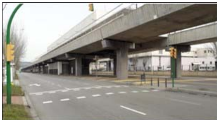
Port Comercial: Vista general Estació