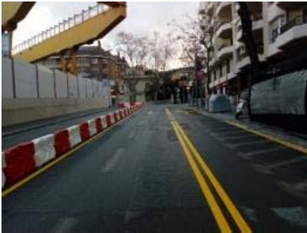
Desviament Carrer Mandri