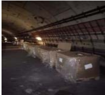
Noves fixacions a obra

Previsió de finalització: maig 2021+ lectures per veure reducció vibracions