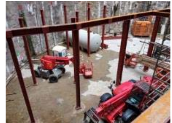
Estructura metàl·lica forjat provisional pou estació Camp Nou