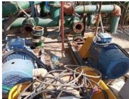
Canvi de les bombes de la torre de refrigeració