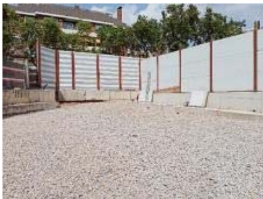
Capa drenant zona enjardinament Fase 1 de la finca de les monges