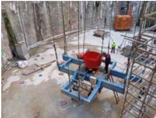
Treballs de reparació de les pinces de la grua pòrtic