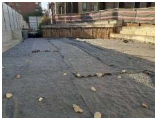
Col·locació geotèxtil filtre a la zona enjardinament Fase 1 finca de les monges