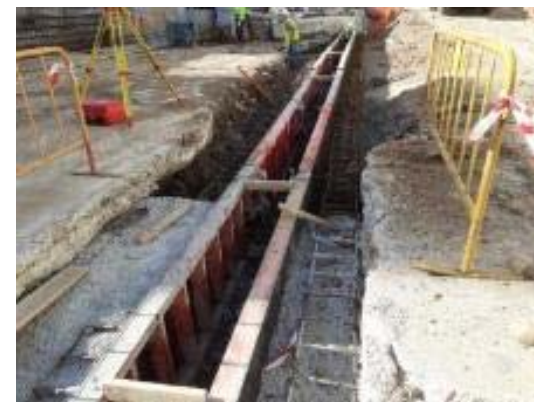
Execució del muret guia de les pantalles del vestíbul