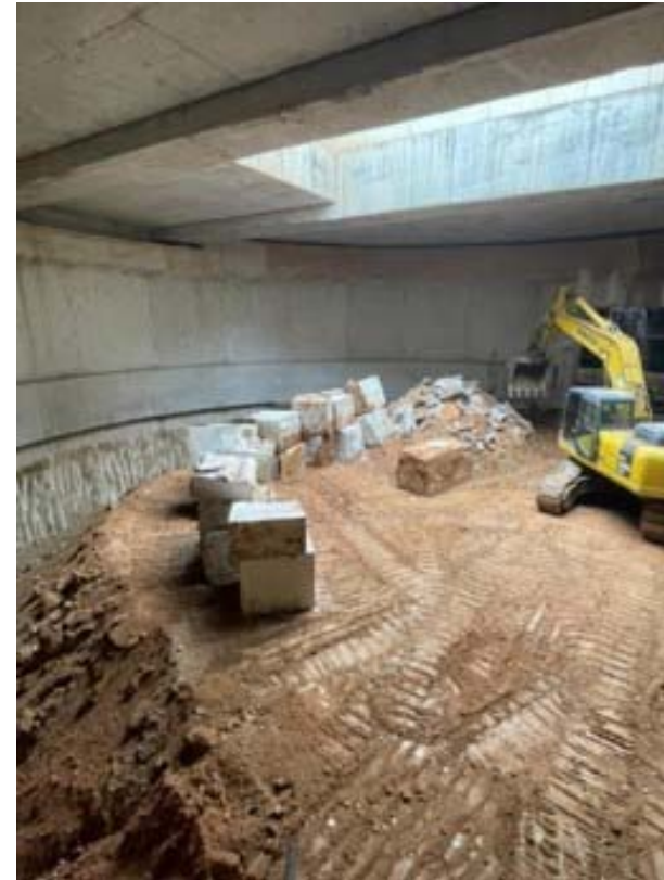
Treballs preparatoris a l'excavació del pou