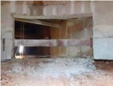
Obertura de la connexió entre el pou i la sortida d'emergència i ventilació