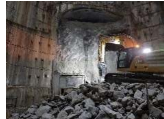
Demolició del dau de formigó d'accés al túnel des del pou de Guinardó