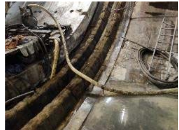
Substitució dels raspalls a la cua de l'escut