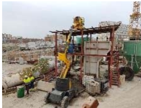
Retirada de la depuradora al Macropou