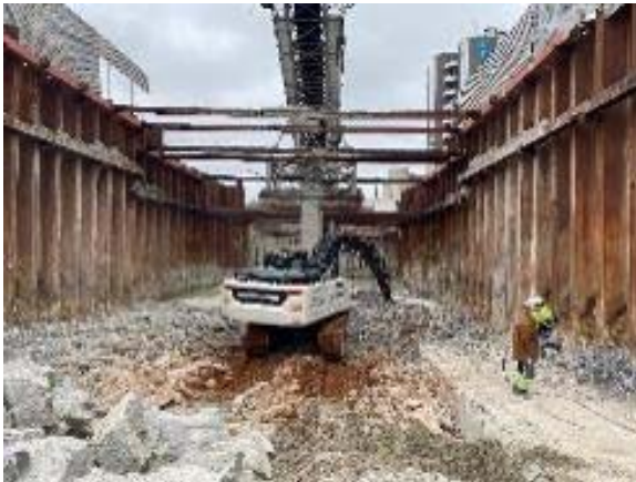
Demolició de la llosa del fossat de terres