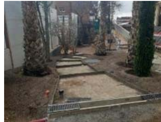
Treballs d'urbanització de les Germanes Missioneres