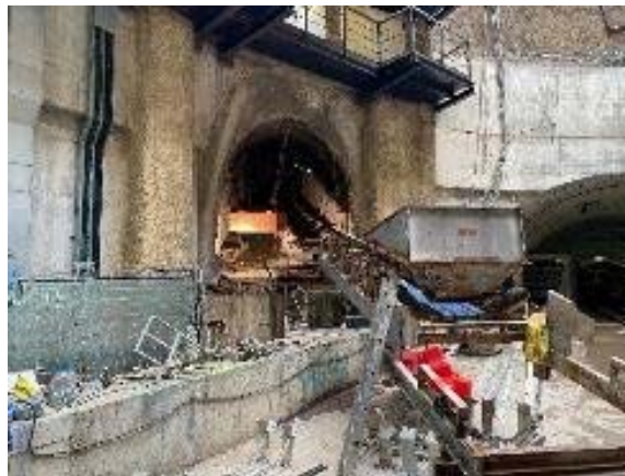
Instal·lació de la cinta a la galeria