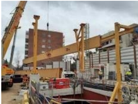
Muntatge del pòrtic grua