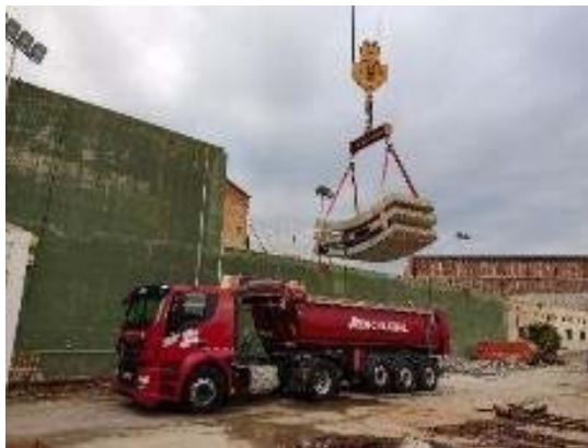
Retirada de dovelles emmagatzemades a Macropou