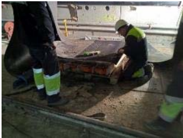
Posada a punt de la cinta transportadora