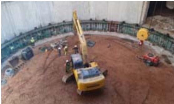
Encofrat de l'anell 2