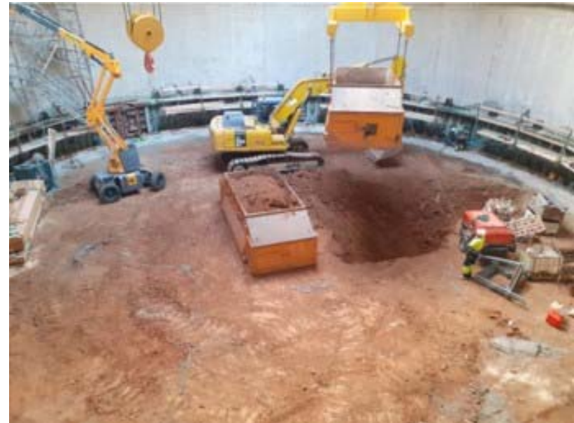
Excavació del pou