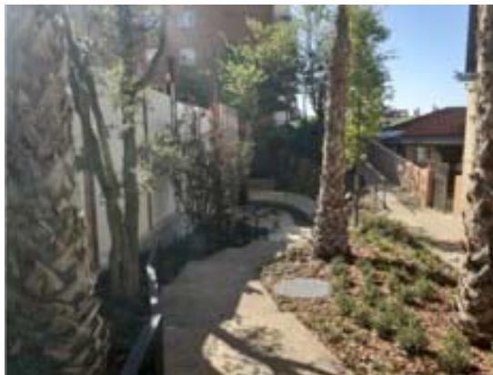
Treballs d'urbanització del jardí de les Germanes Missioneres