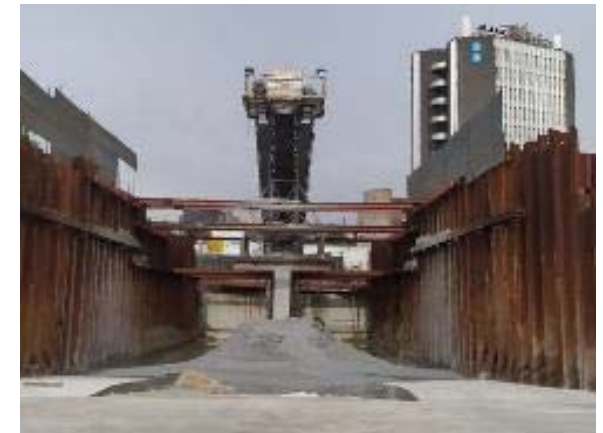
Material excavat en fase de proves acumulat al pou de terres