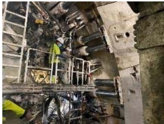
Instal·lació dels primers anells de prova