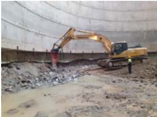
Excavació i treballs de l'anell 8