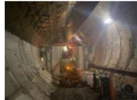
Desmuntatge porta accés tuneladora i preparació de material per inici de desmantellament