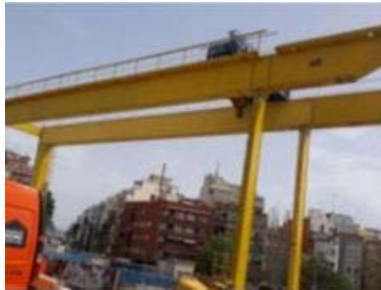
Instal·lació pòrtic grua pou de Guinardó