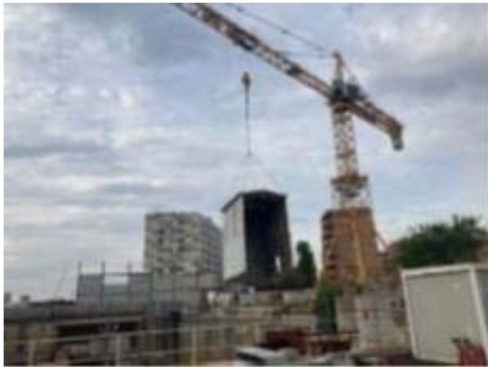
Desmuntatge d'instal·lacions existents a Macropou