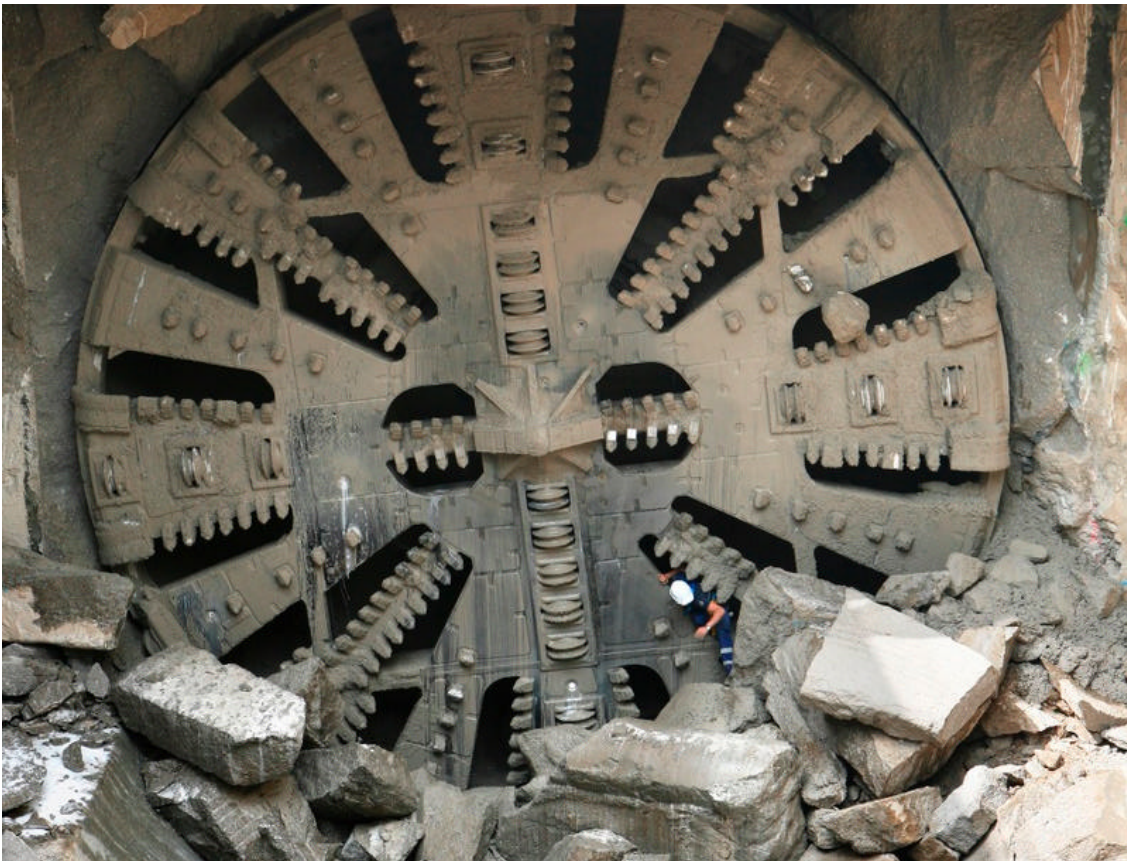
Imatge de la calada del túnel fins a l'aeroport de Barcelona

El president de la Generalitat, José Montilla, i el conseller de Política Territorial i Obres Públiques, Joaquim Nadal, han visitat avui les obres de construcció de l'L9, coincidint amb la finalització del túnel fins a la nova terminal T-1 de l'Aeroport de Barcelona. Així, avui s'ha extret el capçal de la tuneladora, un cop ha completat el tram de túnel de 4,3 quilòmetres des de Mas Blau fins a la T-1. Pel que fa a les 3 noves estacions que permetran millorar les connexions amb transport públic fins a l'aeroport, es troben en ple desenvolupament. Es preveu que aquest tram es posi en servei durant el 2012.